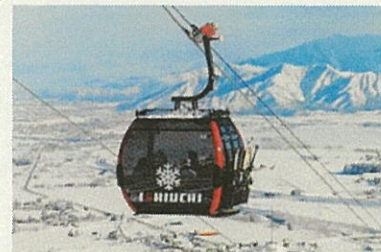
索道の再編や搬器の大型化・高速化により、混雑を改善し、快適性・満足度を向上