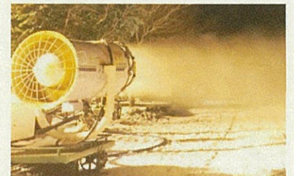
高機能な降雪機の導入により、営業期間を最大化・明確化