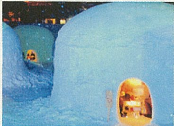
アフタースキーを楽しめる環境を整備し、外国人観光客の長期滞在を促進