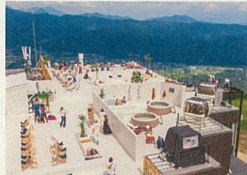
グリーンシーズンも楽しめる環境を整備し、通年での誘客を促進